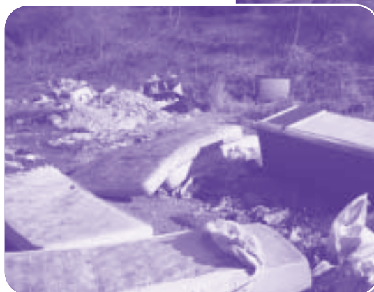
C.da Vesciolo Prima ...