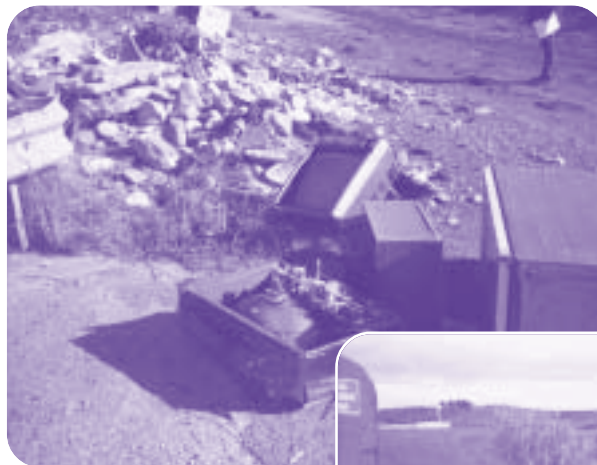
Via Fontanelle Prima ...

Sono 12 le Ordinanze sindacali con le quali dal luglio 2003 a febbraio 2005, il Comune di Rionero ha proceduto a bonificare 16 siti interessati dalla presenza di rifiuti di ogni genere. Nonostante il controllo della Polizia Municipale, del Corpo Forestale dello Stato e della Polizia Provinciale, la campagna di sensibilizzazione relativa all'avvio del servizio gratuito di raccolta dei rifiuti dei generi durevoli - ingombranti e speciali, il territorio comunale continua ad essere teatro di incivile abbandono da parte di ignoti. La tabella allegata, tra l'altro, mette in risalto come gli interventi si ripetano in Contrada Pesco ma anche come le ordinanze abbiano interessato strade o zone centrali della Città. Si tratta di impegni di spesa notevoli che, togliendo fondi alle casse comunali, impediscono di progettare il miglioramento della qualità della vita urbana. Di qui l'invito a tutti i cittadini a non abbandonare rifiuti lungo le strade della periferia, a prestare attenzione segnalando e denunciando coloro che si rendono protagonisti di abbandoni ingiustificati.