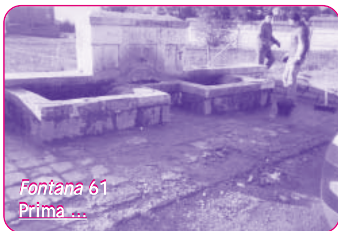
Fontana 61 Prima ...