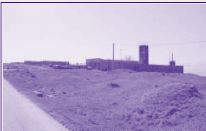
C.da Pesco - rifugio canile comunale

I l Progetto preliminare è pronto, comprensivo del parere favorevole dell'Ufficio Veterinario dell'ASL n.1 di Venosa, dopo la sigla del protocollo d'intesa tra i tre comuni consorziati, il Comune di Rionero potrà presentare richiesta di finanziamento alla Regione Basilicata avviando in questo modo l'iter ufficiale per la realizzazione del Canile Intercomunale. Rionero in Vulture, Atella e Barile anche in questa occasione, convergono per fronteggiare un problema annoso: il randagismo. Con la costruzione del Canile Intercomunale, si potrà offrire una risposta concreta al fenomeno tutelando, nel contempo, gli animali da affezione. Il progetto interessa l'area di C.da Pesco di Rionero (già sede di un rifugio per cani affidato in gestione alla Lega Nazionale per la Difesa del Cane di Lavello). Prevede la realizzazione di un rifugio per l'accoglienza di un massimo di 200 cani abbandonati, con annesso Canile Sanitario. In attesa del completamento del nuovo progetto, la struttura di Contrada Pesco, ospita numerosissimi cani raccolti per strada o abbandonati dinanzi ai cancelli. Tutti i quadrupedi sono iscritti in apposito registro (le femmine sterilizzate) pronti per essere adottati dai veri amanti degli animali.