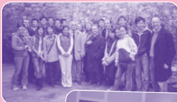
Studenti Cinesi della St. Andrews University (Scozia) in visita a Rionero in Vulture

Il Consiglio Comunale di Rionero ha approvato a maggioranza, il Bilancio di previsione 2005. A grandi linee la manovra finanziaria conferma la spesa del 2004. Ad eccezione di un aumento delle tariffe TARSU del 15%, il bilancio non prevede altri inasprimenti fiscali e tariffari. In merito all'aumento della tassa sulla raccolta dei rifiuti solidi e urbani, si tratta di una necessità per evitare di applicare dal 2006 interamente l'adeguamento così come previsto dalla normativa statale. Confermate le somme destinate ai vari servizi ed in particolare quelle relative all'assistenza agli indigenti, al trasporto per disabili AIAS, alle attività ricreative e sportive, alla gestione del centro diurno per disabili, la raccolta e lo smaltimento dei rifiuti ingombranti, l'adeguamento del canone per il trasporto scolastico. A questi si sommano nuovi servizi come il centro comunale anziani o anche il miglioramento economico per il personale. Il Comune di Rionero, anche per il 2004, ha rispettato criteri e vincoli posti dalle norme dettate in materia di patto di stabilità interno.